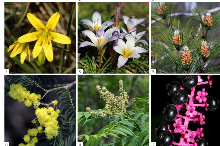
Fauna 1 Raposa Vulpes vulpes 2 Javali Sus scrofa 3 Águia-de-asa-redonda Buteo buteo 4 Lagartixa-do-mato Psammodromus manuelae 5 Cobra-rateira Malpolon monspessulanus 6 Chapim-azul Parus major