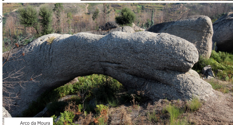
Arco da Moura

Sugere-se o início do percurso no centro de BTT da aldeia de Várzea de Candosa, devendo seguir-se em direção ao centro da mesma, merecendo um olhar atento as diversas fontes existentes, o casaríio em granito e a praça contígua à Capela de Santo Amaro.