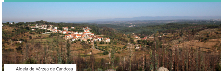
Aldeia de Várzea de Candosa

A Rota das Pontes, percurso circular com uma extensão de 14 km, insere-se no projeto transversal “Rios e Zonas Húmidas” da CIM-RC, permitindo a descoberta do património natural e cultural desta região beirã, moldada pela presença do granito e dos seus cursos de água, entre os quais o rio Cavalos.