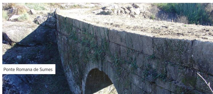
Ponte Romana de Sumes

Nos afloramentos graníticos marcam presença as espécies bolbosas como o narciso endemismo lusitânico, constante dos Anexos II e IV da Diretiva Habitats, a cebola-albarrã, a Gagea soleirolii e a Romulea bulbocodium .