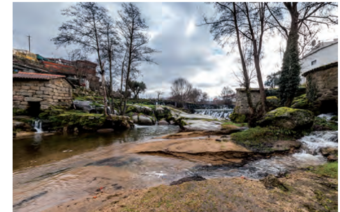
Rio Cavalos / Sevilha

Via Romana - O troço tinha a sua proveniência em Bobadela e dirigir-se-ia para Santarém, passando por Tomar. Historiadores e arqueólogos defendem também, ao invés, que o troço podia estar integrado numa trajectória de ligação entre Bobadela e o itinerário entre Olissipo (Lisboa) e Bracara Augusta (Braga), entroncando esta na zona da Mealhada. Pelo que ainda se pode observar, a via apresenta uma largura média de 4,70m, prolongando-se os seus vestígios por uma extensão de aproximadamente 350m. Pedra da Sé - é um aglomerado granítico de alto relevo e constitui um ícone intemporal do concelho, sendo, per si, um magnífico miradouro. Envoltos em algumas histórias e mistérios (aliados à figura de João Brandão), a derivação da sua toponímia também não é consensual: talvez daqui tenha saído pedra para a construção da Sé de Viseu ou da de Coimbra, e daí ter resistido a associação de "pedra para (da) Sé"; outra possibilidade reside na imponência do complexo rochoso em si, fazendo lembrar, pelas dimensões, uma Sé. Certo é que nas Inquirições de D. Afonso III a Pedra da Sé surge como referência à divisória do couto do Lorvão, pertencendo o que é hoje Tábua e o seu concelho a Coimbra.